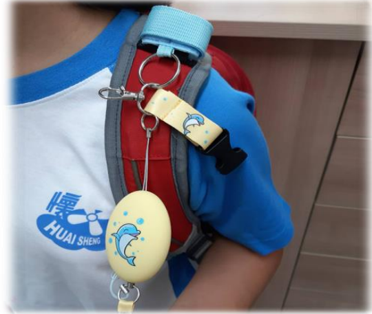
圖2 綁在書包肩帶扣環上