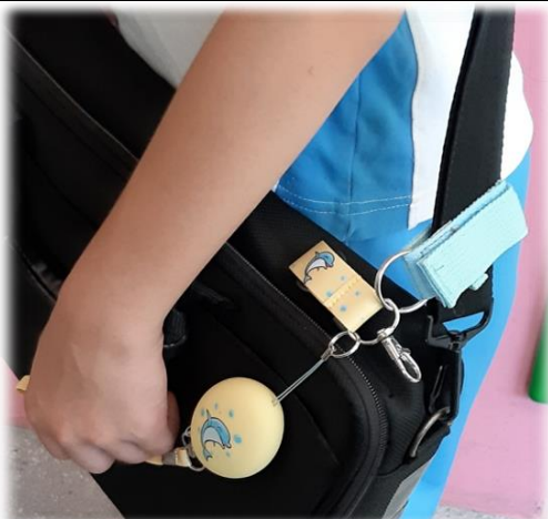
圖5 單肩或斜背書包，綁在帶子或扣環