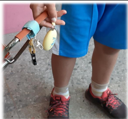
圖4 纏在書包提把上