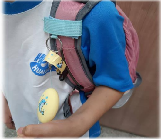
圖1 綁在書包肩帶上