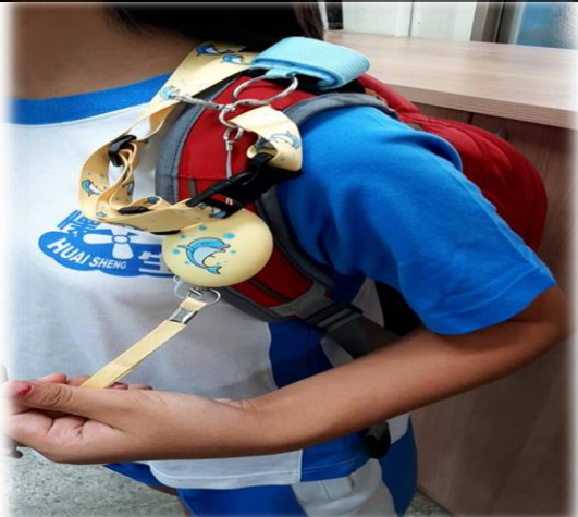
圖3 繞過提把纏在肩帶上